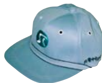
私は“ふれあい”帽子

今回は「豊中市立原田学校給食センター」と「豊中市緑と食品のリサイクルプラザ」に伺い、「とよっぴー」の製造過程である生ごみ脱水・パン粉碎業務を取材しました。