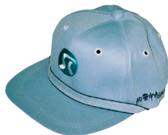
私は“ふれあい”帽子